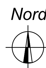
PLANIMETRIA DI RILIEVO - 1/200