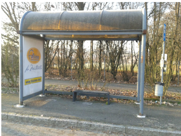
Fermata 2 V. Risorgimento 217 scuole el. Ponte Ronca Direzione Bologna