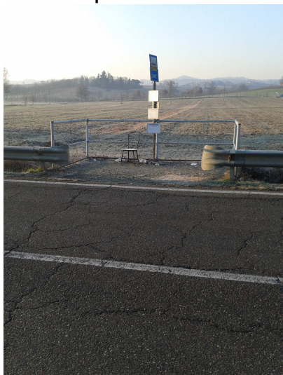
Fornitura di nuove pensiline in fermate ora sprovviste