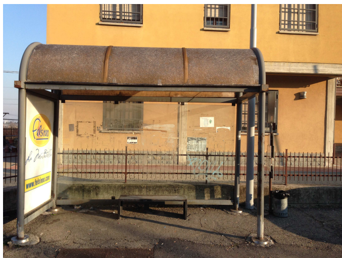
Fermata 8 V. Risorgimento prima dell'intersezione con V. Nievio. Direzione Modena