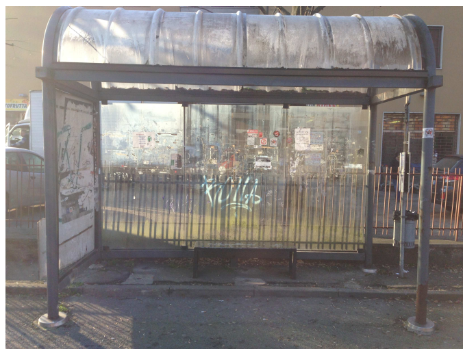
Fermata 7 V. Risorgimento prima dell'intersezione con V. Guicciardini. Direzione Bologna