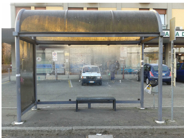
Fermata 4 V. Risorgimento 163 ex Farmacia. Direzione Bologna