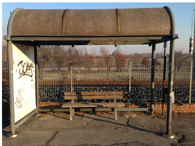
Fermata 5 V. Risorgimento intersezione V. Del Calcagno. Direzione Modena