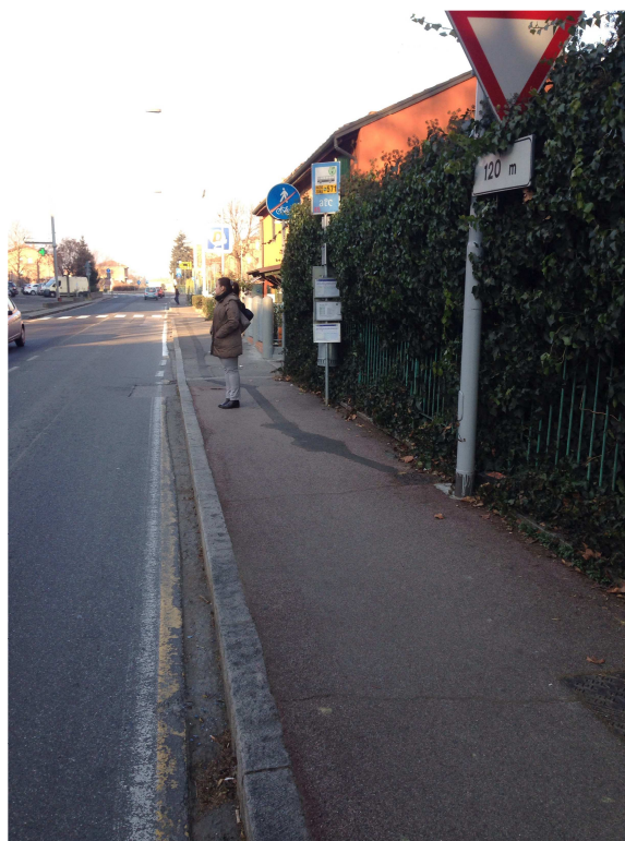
Fermata 13 V. Risorgimento prima del civico 176. Direzione Modena N.B. Sprovvisa di pannello laterale e seduta