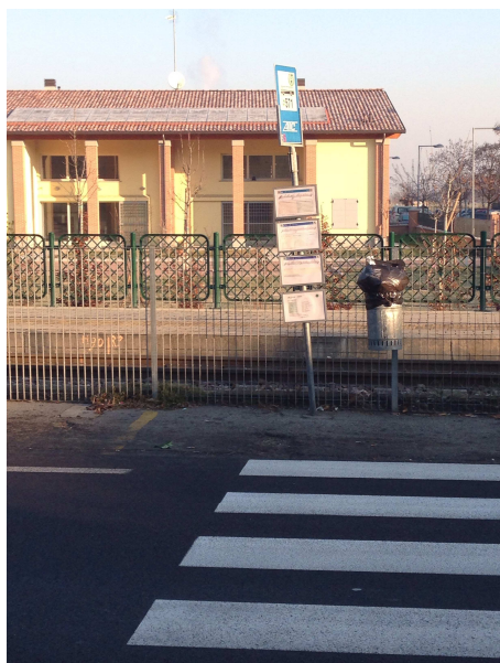
Fermata 12 V. Risorgimento di fronte civico 185.