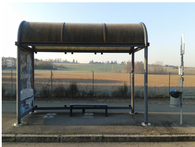
Fermata 3 V. Risorgimento prima dell'intersezione con V. San Pancrazio Direzione Bologna