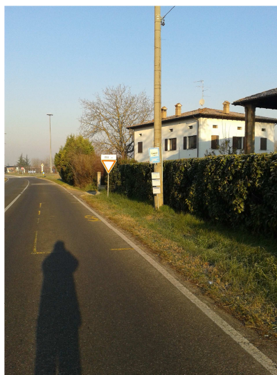
Fermata 10 V. Risorgimento dopo l'intersezione con V. San Martino. Direzione Bologna