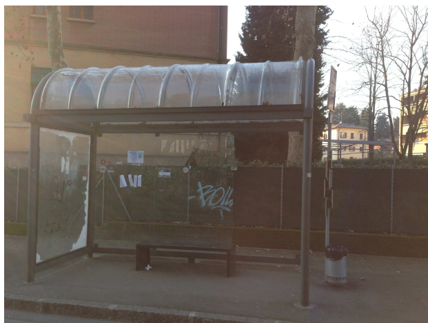
Fornitura di nuove pensiline in fermate ora sprovviste