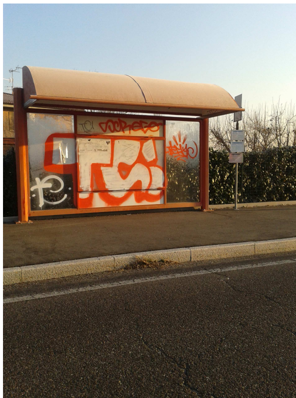
Fermata 1 V. Risorgimento c/o 442 Direzione Modena