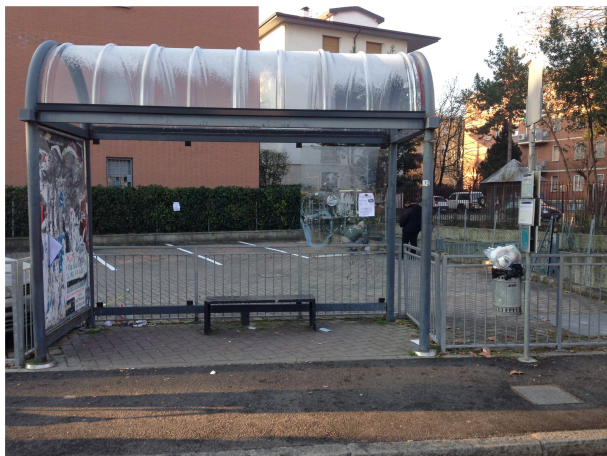
Fermata 6 V. Risorgimento c/o n 75. Direzione Bologna